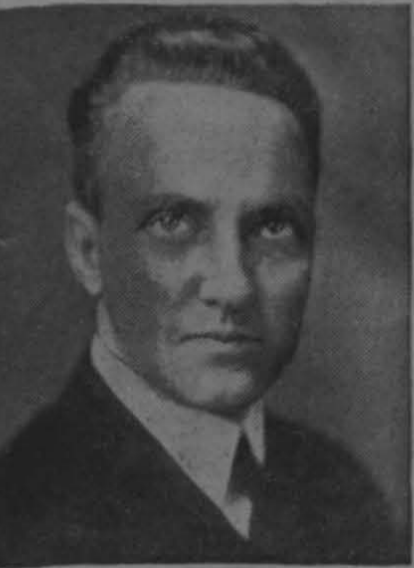
TRAS MIL CALAMIDADES LITTLE AMERICA, 13. — Tres miembros de los del grupo del tractor, después de dos inútiles intentos, lograron llegar al avanzado lugar donde se encontraba aislado el Almirante Richard E. Byrd, a través de la barrera del Mar de Ross, encontrando a Byrd, quien estaba esperando. Se abrió una especie de escotilla sobre la vivienda escondida por largos cinco meses entre la nieve, y apareció un hombre delgadísimo, extremadamente barbado, denotando los sufrimientos experimentados durante ese tiempo en aquel nido remoto. Era el Almirante Richard E. Byrd, quien recibiendo a los exploradores del Little America, les saludó regocijado en la siguiente forma:

Lo encontraron sumamente débil, pero sano. Las sirenas de N. York celebraron el acontecimiento